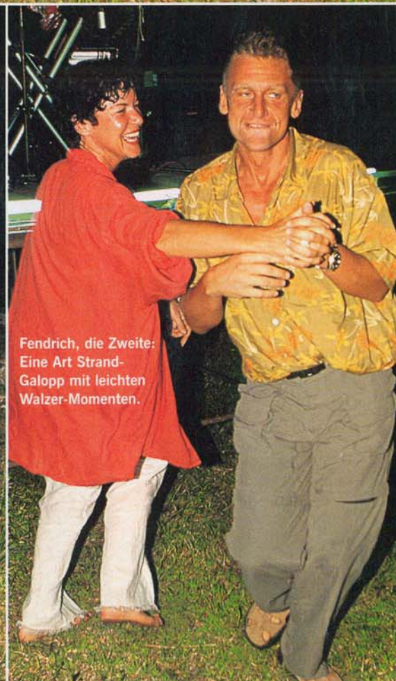
Fendrich, die Zweite: Eine Art Strand-Galopp mit leichten Walzer-Momenten.