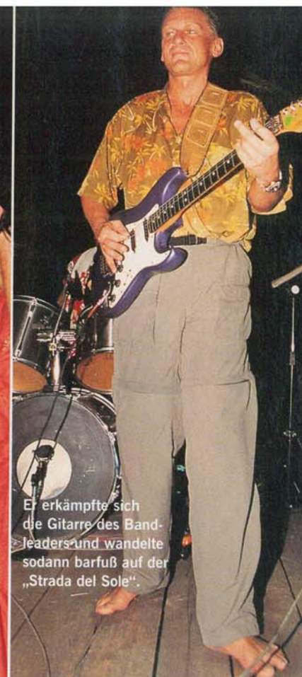
Er erkämpfte sich die Gitarre des Bandleaders und wandelte sodann barfuß auf der „Strada del Sole“.